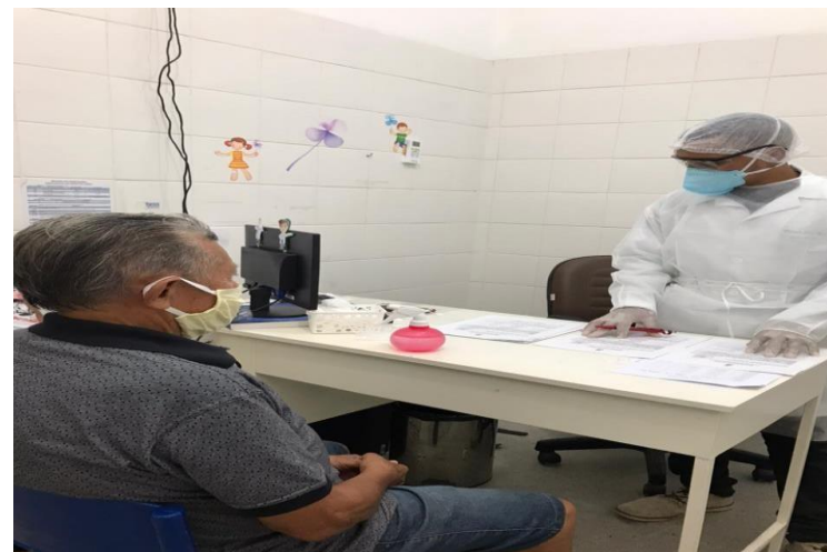
Clínica de Saúde da Família Dr. Geraldo L. S. Mota (SESP), realizando junto com a equipe da UFS testagem para COVID-19 em seus usuários.