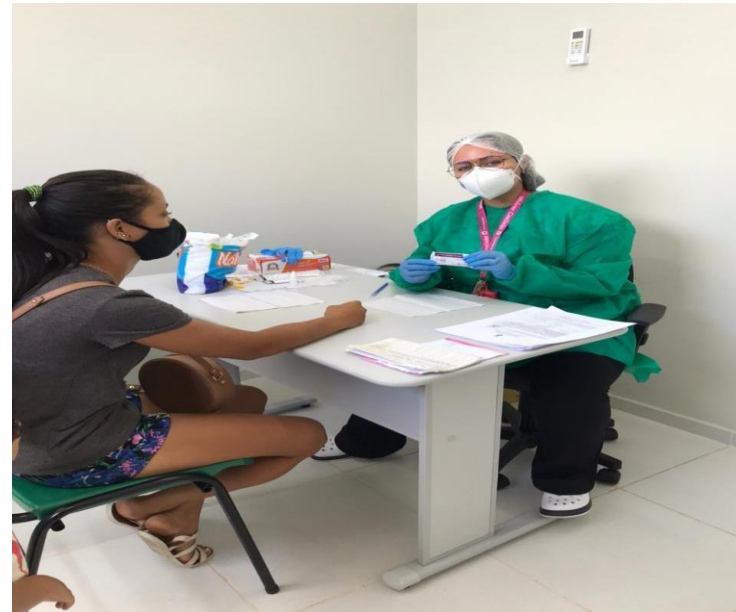
Unidade de Saúde da Família do pov. Barracas, realizando junto com a equipe da UFS testagem para COVID-19 em seus usuários.