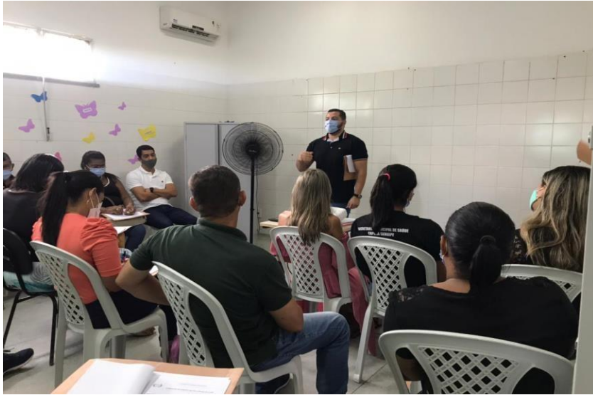
Capacitação com os gerentes da Secretaria Municipal de Saúde (SMS).