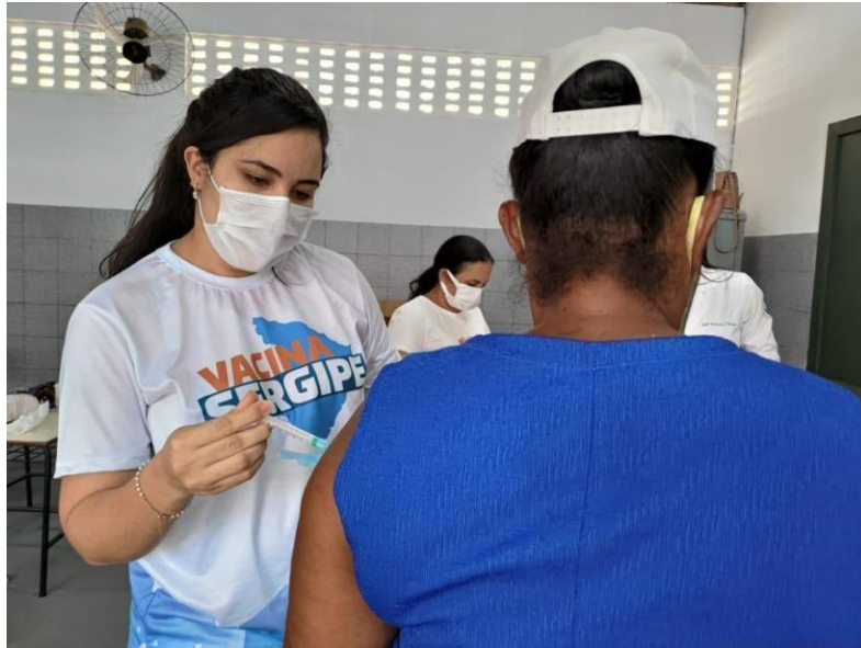
Vacinação da comunidade Quilombola do pov. Terra-Dura.