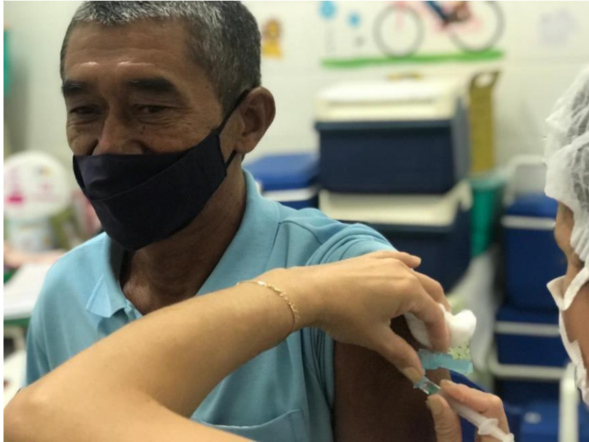
Vacinação contra a COVID-19 em idosos >63 anos.