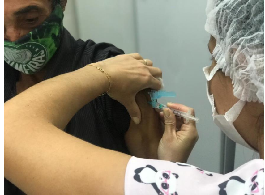
Vacinação contra a COVID-19 em idosos >63 anos.