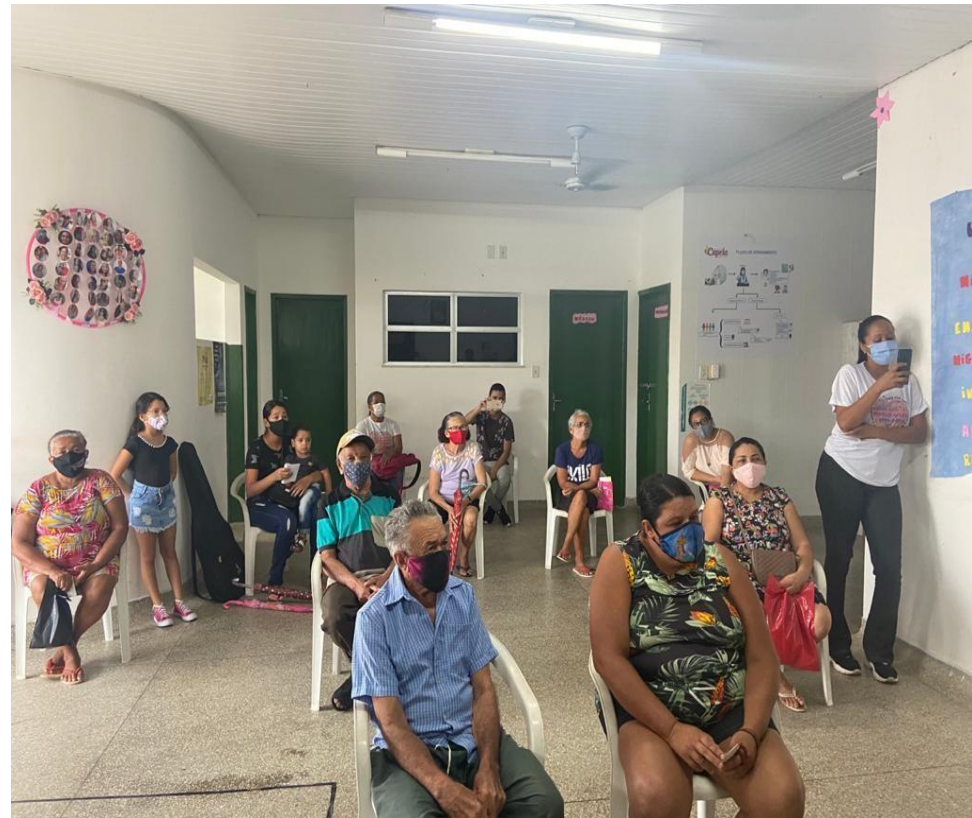
Abril Azul (Conscientização sobre autismo), USF Milton Calumbi Tourinho.