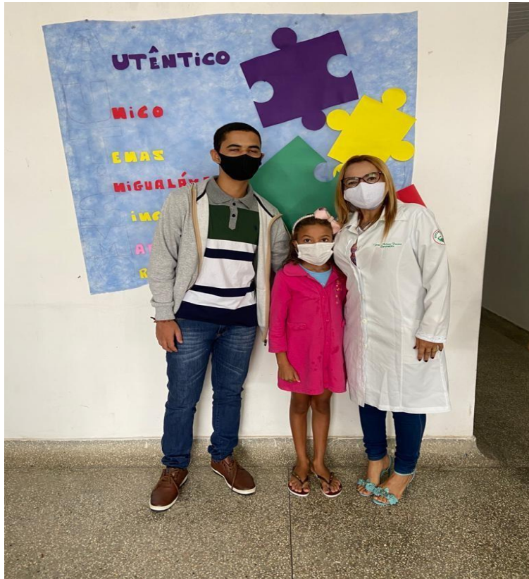
Abril Azul (Conscientização sobre autismo), USF Milton Calumbi Tourinho.