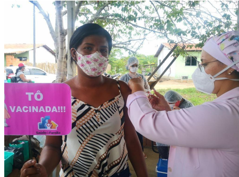
Vacinação da comunidade Quilombola, Pirangi.