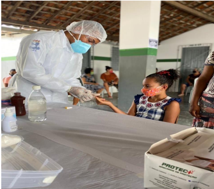
Unidade de Saúde da Família do pov. Boa Vida, realizando junto com a equipe da UFS testagem para COVID-19 em seus usuários.