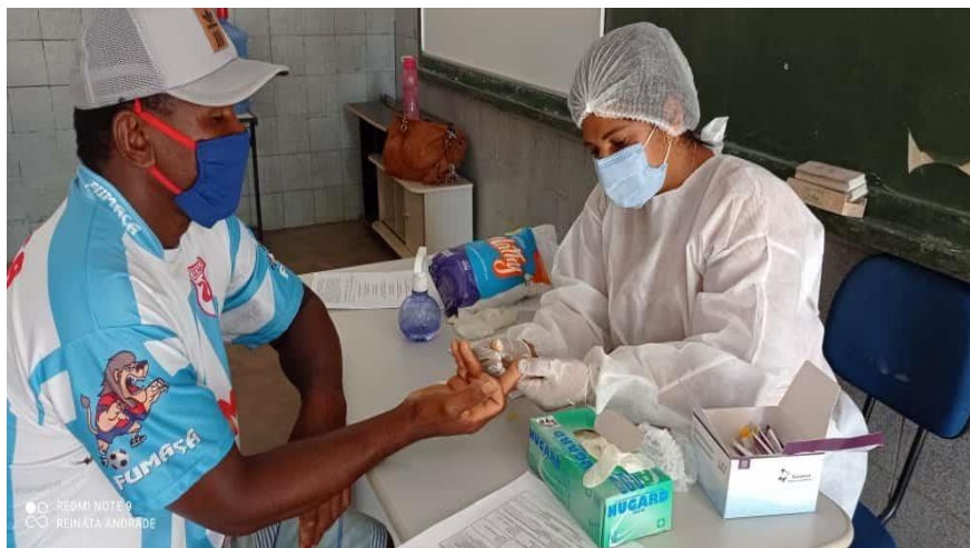
Unidade de Saúde da Família dos pov. Saúde e Quixaba, realizando junto com a equipe da UFS testagem para COVID-19 em seus usuários.